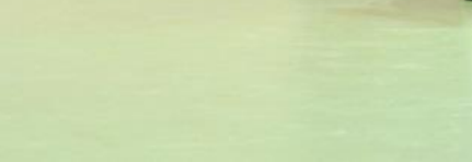
Roger Capra janv 2022